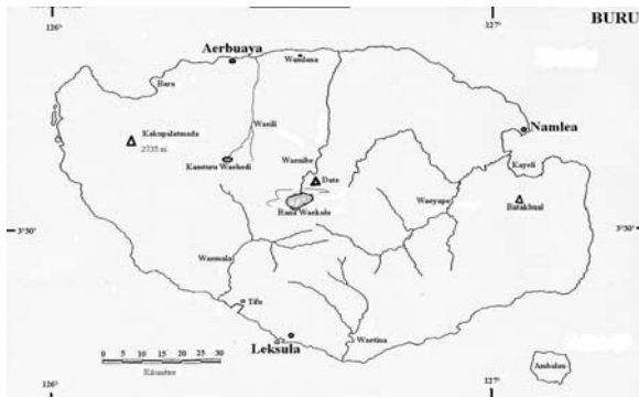
Gambar 1. Pulau Buru, Provinsi Maluku

orang Bupolo. Di antara penduduk, dibedakan antara penduduk asli ( autokton ) yang mendiami wilayah pegunungan dan terisolir dengan jumlah 9,8% (12.008), dan penduduk pendatang ( alokton ) mendiami daerah pesisir pantai. Pendatang adalah warga keturunan Cina dan Arab, ditambah dengan suku lainnya dari Nusantara. Sejarah perdagangan rempah dan kayu putih yang menghantar mereka ke pulau ini ratusan tahun yang lampau. Penduduk makin plural dengan hadirnya sekitar 10.000 tahanan politik G30S/PKI (1969-1979), dan setelah itu masuknya program transmigrasi. Mayoritas penduduk adalah petani-nelayan (pesisir pantai), sedangkan autokton di pegunungan berprofesi sebagai petani-berburu.