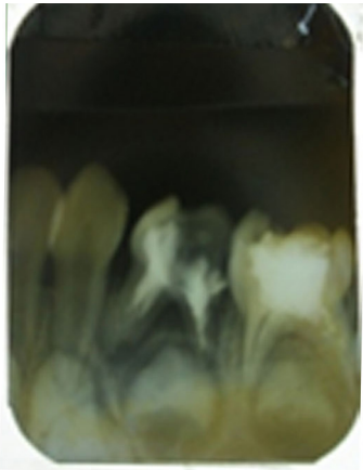
Gambar 2. Pengisian dengan ZOE telah dilakukan pada gigi 74