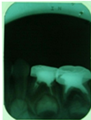
Gambar 3. Evaluasi setelah pemasangan mahkota logam pada gigi 74 dan 75