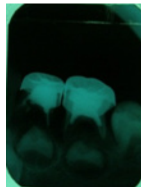
Gambar 5. Kondisi klinis dan radiograf 7 bulan setelah perawatan. Terlihat gambaran radiolusen yang luas pada periradikular gigi 74.