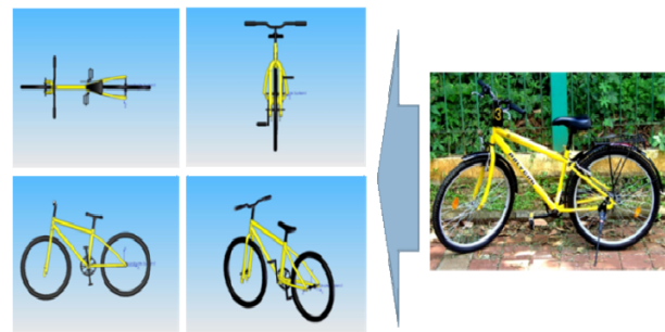
Gambar 1. Desain Sepeda UI

Virtual environment (VE) merupakan representasi tiruan sistem fisik yang dihasilkan oleh komputer yang memungkinkan pengguna untuk berinteraksi dengan lingkungan sintesis (tiruan) yang memiliki kemiripan dengan lingkungan nyata [5]. VE merupakan lingkungan artifisial yang diciptakan oleh komputer dan digunakan secara real-time [6]. Lingkungan artifisial ini dapat berupa sebuah model tiga dimensi yang berisi