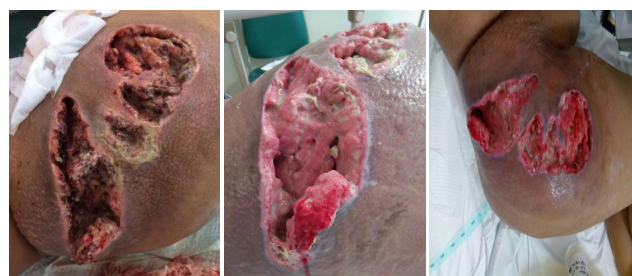
Gambar 2. Paha kanan pasien setelah dilakukan tindakan debridement

Pada hari ketiga perawatan, paha kanan pasien tampak semakin membesar, dengan permukaan kulit tampak eritematosa dan nyeri bila disentuh, tanpa terdapat indurasi ataupun bula. Pasien dikonsultasikan ke bagian bedah thorakovaskuler untuk tindakan debridement . Tindakan debridement dilakukan pada hari kedelapan perawatan (Gambar 3). Jaringan subkutan dikirimkan untuk pemeriksaan mikroskopis, kultur dan sensitivitas, serta pemeriksaan histopatologis.