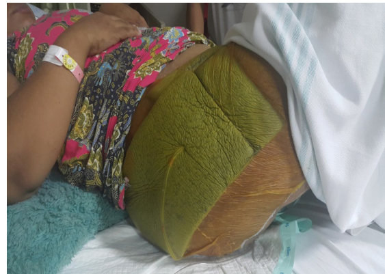
Gambar 3. Paha kanan pasien setelah dipasang VAC dressing

Selanjutnya, pasien dikonsultasikan ke bagian bedah plastik untuk penutupan luka.