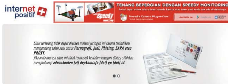
Gambar 5. Peringatan 'Internet Positif' terhadap situs KoreanNC.

ta biasanya anonim sehingga tidak mudah ditelusuri. Budaya partisipatoris yang berlaku dalam konteks budaya populer juga menjalar ke ranah pornografi. Blog sebagai salah satu manifestasi teknologi 2.0 tidak lepas dari konteks ini, bahkan blog dianggap sebagai salah satu medium yang mampu mendistribusikan pornografi secara masif dan terus diperbarui. Bahkan menurut Bradford (2010), para blogger memandang diri mereka berada dalam garda depan dunia pasca-pornografi ( "bloggers do see themselves at the vanguard of a post-pornography world" ). Fleksibilitas blog juga mendorong keberadaan blog seks yang kebanyakan nonkomersil dan dibuat oleh perempuan.