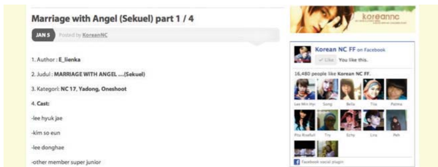
Gambar 2. Cara penulis menginformasikan genre karya fiksi penggemar

Jika di beberapa negara seperti Amerika Serikat perkembangan karya fiksi penggemar mulai tumbuh melalui medium zine yang