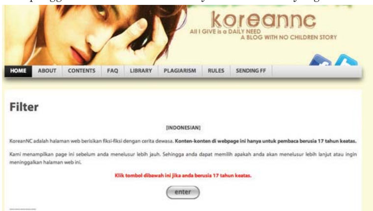
Gambar 1. Tampilan halaman muka blog KoreanNC.

penggemar dengan traffic paling ramai di Indonesia adalah www.koreannc.wordpress.com (yang menjadi bahasan utama dalam tulisan ini), yang hanya menampung karya ber- genre romantis-erotis. KoreanNC telah dikunjungi lebih dari 41.451.715 kali hingga 10 Januari 2013. Baik pembaca dan penulisnya aktif berinteraksi di dalam dan luar blog seperti Twitter. Berdasarkan pengamatan selama 2012, sebagian besar pembaca dan penulis masih berumur di bawah 25 tahun (admin situsnya berumur 21 tahun), yang rata-rata adalah penggemar artis K-pop. Blog ini menyajikan lebih dari satu genre karya fiksi penggemar, tidak hanya narasi romantis dengan unsur erotis yang eksplisit yang dominan, cerita hubungan sesama jenis dan yang mengandung unsur kekerasan juga bisa diakses di dalamnya. Unsur erotis yang muncul di