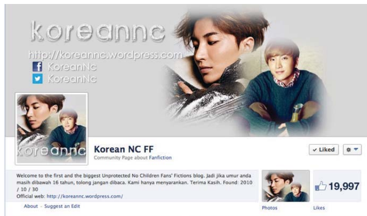
Gambar 3. Fan page KoreanNC di Facebook

Sejak awal berdiri hingga saat ini, jumlah kategori dan kontribusi para penulis di KoreanNC selalu bertambah. Meskipun blog dianggap sebagai me-