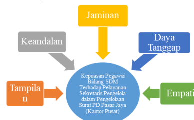
Gambar 1 Model Penelitian

Model penelitian yang dipakai diturunkan dari model Kepuasan Pegawai Bidang Sumber Daya Manusia Terhadap Pelayanan Sekretaris Pengelola dalam Pengelolaan Surat PD Pasar Jaya (Kantor Pusat).