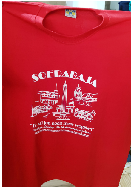
Gambar 3. Desain Kaos Cak Cuk Tempat Bersejarah Kota Surabaya.

di antaranya Ik zal jou nooit meer vergeten, Soerabaja ... Soerabaja ... Aku tak pernah melupakanmu menandakan bahwa teks visual yang ditampilkan berupa tugu, gedung atau bangunan memiliki keterkaitan dengan konteks sejarah Kota Surabaya.