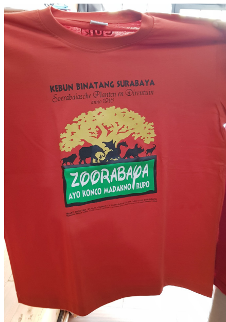
Gambar 5. Desain Kaos Cak Cuk Tempat Ikonik di Kota Surabaya. (Sumber: Dokumentasi Peneliti/Wildan & Irsyad 2019).

Makna konotatif desain Cak Cuk tempat ikonik Kota Surabaya itu berhubungan dengan pemahaman masyarakat setempat tentang sebuah kawasan lokalisasi pelacuran yang sangat terkenal di Kota Surabaya yang bernama Dolly, dan tulisan Ditutup! Buyar berkorelasi dengan peristiwa penutupan secara permanen tempat prostitusi terbesar di Asia Tenggara itu oleh wali kota yang menjabat pada 2014, yaitu Drs. Tri Rismaharini. Penutupan itu disebabkan oleh penyalahgunaan Perda Nomor 7 Tahun 1999 mengenai larangan bangunan dijadikan tempat asusila. Sebagai negara dengan mayoritas penduduk beragama Islam, Doly sebagai tempat pelanggaran moral bertentangan dengan aturan agama.