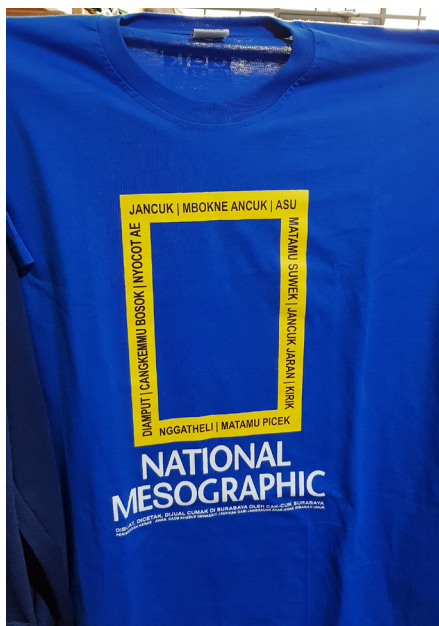
Gambar 8. Desain Cak Cuk Bahasa Umpatan Khas Kota Surabaya (Sumber: Dokumentasi Peneliti/Wildan & Irsyad 2019).

Pada tahap mitos, desain kaos di atas merepresentasikan kondisi budaya masyarakat Surabaya dalam penggunaan ungkapan umpatan yang beragam. Berdasarkan penelusuran sejarah, ungkapan umpatan yang paling sering diujarkan oleh orang Surabaya adalah kata Jancok . Kata itu muncul dengan berbagai versi, yaitu bahasa Arab, cerita penjajahan Belanda, penjajahan Jepang, dan versi tank Belanda. Menurut cerita versi Arab, kata Jancok berasal dari bahasa Arab da'suk (tinggalkanlah kejelekan atau keburukan). Menurut versi penjajahan Belanda, kata Jancok berasal dari bahasa Belanda yantye ook (kamu juga). Menurut versi cerita penjajahan Jepang, kata Jancok berasal dari bahasa Jepang sudanco (ayo cepat). Sementara itu, menurut cerita tank Belanda, kata Jancok berasal dari kata jan cox , nama dari seorang pelukis Belanda yang wajahnya tergambar dalam tank Belanda. Dari beberapa versi itu, kata Jancok sebenarnya adalah gambaran tentang masyarakat Kota Surabaya yang keras karena kata tersebut sebenarnya merupakan ungkapan kekecewaan dan perlawanan terhadap penjajah. Namun, dalam perkembangannya, kata itu digunakan untuk menunjukkan rasa emosi kepada lawan bicara ketika terjadi hal-hal yang kurang berkenan. Akan tetapi, kata tersebut juga sering digunakan oleh masyarakat Kota Surabaya sebagai tanda atau rasa persaudaraan. Orang yang telah lama saling mengenal biasanya menggunakan kata itu untuk bahan lelucon atau kata sapaan.