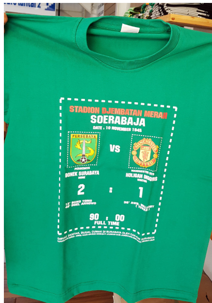
Gambar 2. Desain Kaos Cak Cuk Stadion Djembatan Merah.

perjuangan dan jasa Bung Tomo yang berhasil merebut Kota Surabaya dari tangan penjajah. Warna hitam dan abu-abu pada kaos menunjukkan suasana kelam pada masa itu. Kisah itu selalu diingat oleh masyarakat Kota Surabaya dengan cara mengabadikannya dalam gambar, bahkan pada suatu waktu pernah diadakan seni pertunjukan tentang perjuangan Bung Tomo di Tugu Pahlawan Kota Surabaya. Penelitian terdahulu berupaya mengungkapkan cara seorang tokoh pahlawan dikenalkan oleh publik. Dalam penelitian itu dijelaskan bahwa, meskipun ada tokoh lain dalam pertempuran 10 November di Surabaya, Bung Tomo adalah pahlawan yang paling diingat oleh sebagian besar masyarakat Kota Surabaya, terutama anak sekolah (Chandra, Karsam, & Yursima 2017). Karena keterlibatannya dalam perjuangan kemerdekaan, Bung Tomo menjadi sosok pahlawan yang selalu diingat oleh masyarakat kota Surabaya. Bahkan namanya telah dijadikan nama beberapa tempat penting di Kota Surabaya. Dalam pemaknaan tahap mitos, gambar Bung Tomo yang dimunculkan dalam desain kaos Cak Cuk merepresentasi identitas Kota Surabaya karena berdasarkan penelusuran fakta sejarah dan realitas, Kota Surabaya erat kaitannya dengan kisah Bung Tomo sebagai pahlawan serta tokoh yang paling berpengaruh di Kota Surabaya pada masa lampau. Selain desain itu, Cak Cuk juga masih memiliki desain lain tentang kepahlawanan.