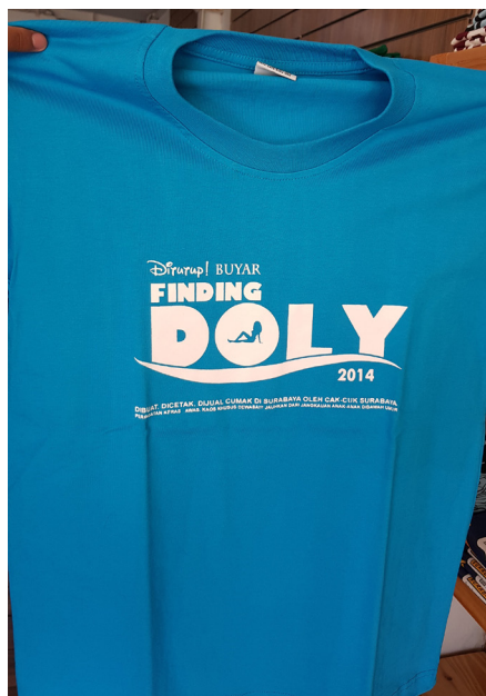
Gambar 4. Desain Kaos Cak Cuk Tempat Ikonis di Kota Surabaya (Sumber: Dokumentasi Peneliti/Wildan & Irsyad 2019).

Makna mitos atau metabahasa pada desain Cak Cuk tempat bersejarah Kota Surabaya, berdasarkan penelusuran fakta di lapangan dan catatan sejarah, Kota Surabaya memiliki bangunan kuno yang masih dilestarikan dan dialihfungsikan sebagai cagar budaya Kota Surabaya. Dalam penelitian terdahulu, desain pada kaos yang memunculkan visual tentang kondisi daerah tertentu telah menjadi tanda realitas sosial suatu daerah (Dadan 2019). Cagar budaya Kota Surabaya, seperti tugu serta bangunan bersejarah yang dimunculkan pada desain Kaos Cak Cuk merepresentasikan realitas sosial budaya yang ada di Kota Surabaya dan merujuk pada kondisi Kota Surabaya yang masih melestarikan peninggalan sejarah.