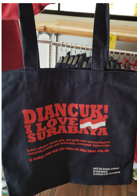
Gambar 6. Desain Cak Cuk Bahasa Umpatan Khas Kota Surabaya

Pada desain tote bag produk Cak Cuk, tercantum teks verbal Diancuk! I Love Indonesia . Teks visual itu menyerupai produk urban streetwear bertuliskan Damn! I Love Indonesia yang sudah dimodifikasi. Makna denotatif dari desain tote bag yang bertuliskan Diancuk! I Love Surabaya dengan gambar bendera merah putih dan kalimat I love Surabaya yang berasal dari bahasa Inggris adalah ungkapan rasa bangga terhadap suatu daerah. Lalu bendera merah putih memiliki makna denotatif bendera kebangsaan negara Indonesia.